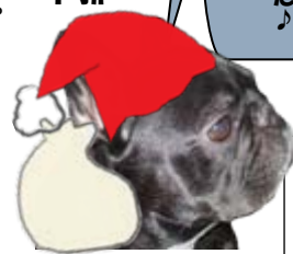
プレゼントはいらんかね～